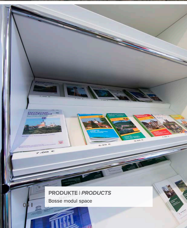
PRODUKTE | PRODUCTS Bosse modul space