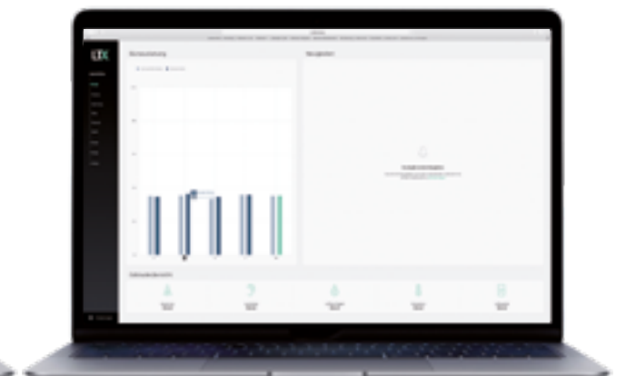
LTX Admin Cockpit